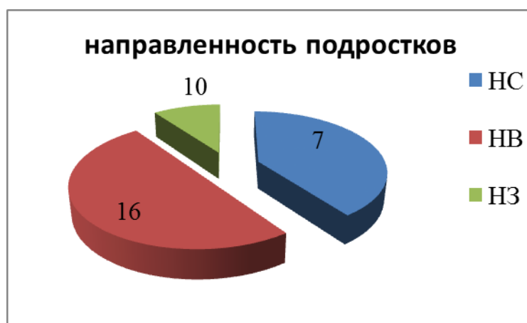
Рис.2 направленность личности подростков

Полученные результаты соответствуют психологическим особенностям подросткового возраста, который определяется как время метаний и поиска себя, выбора ориентиров, отсутствия однозначных решений, ориентация на сверстников и личностное взаимодействие.