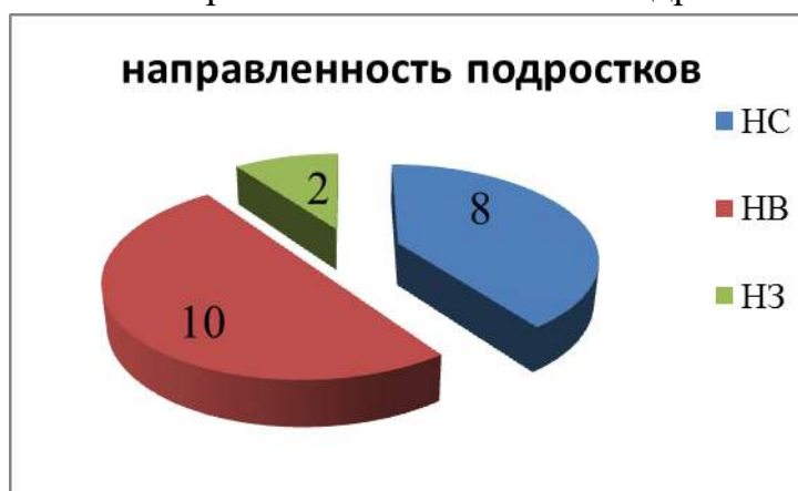
Рис.1 направленность личности подростков

После прохождения программы «Школа волонтера» в полном объеме в мае 2016 года была проведена повторная диагностика «Изучение направленности личности».